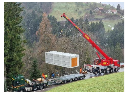
Versetzen am Zielort