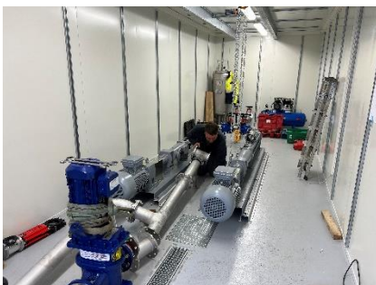
Installation im Container